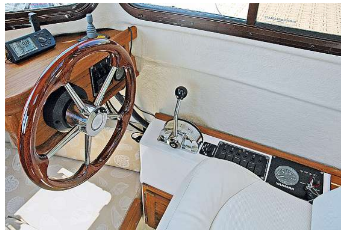
Gewöhnungsbedürftige Lösung: Einige wichtige Kontrollinstrumente wurden aus Platzmangel neben dem Rudersitz montiert