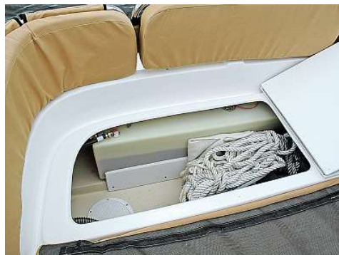
Der 68 l fassende Brennstofftank befindet sich sicher gehaltert unter der Heckbank. Hier können weitere Kleinteile gelagert werden