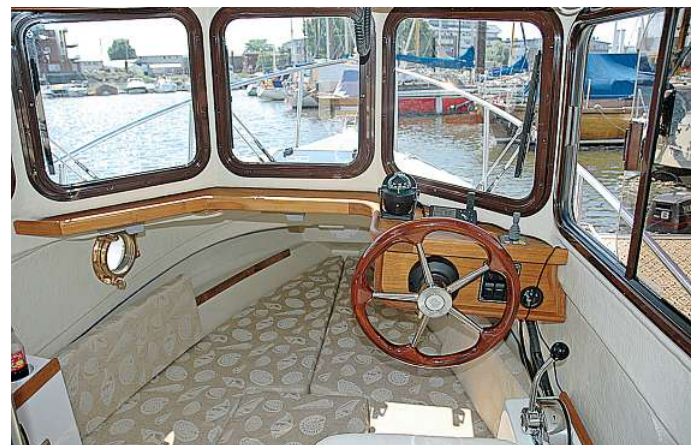
Dank der zahlreichen Fensterflächen, die teilweise geöffnet werden können, präsentiert sich der Fahrstand hell und luftig