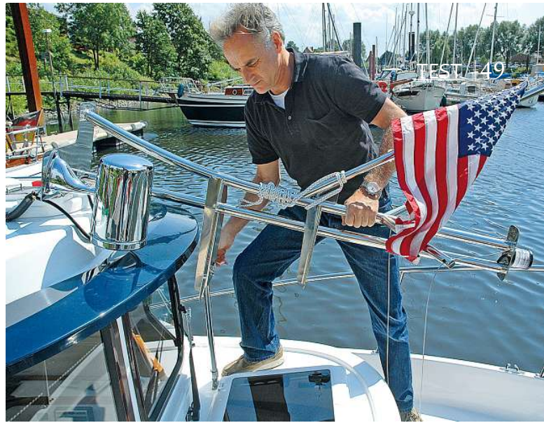
In wenigen Sekunden wird der stählerne Signalmast gelegt, so dass sich die Durchfahrthöhe der R-21EC auf 2,03 m verringert