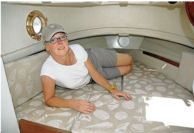
Im vorderen Bereich des Deckshauses wurde eine bequem gepolsterte V-Doppelkoje mit den Maßen 195 x 150 cm angeordnet

der zum Bug hin hochgezogenen Schanz und einer formschönen Seereling flankiert werden, variiert zwischen 10 und 13 cm. Bevor wir unseren Rundgang im Ruderhaus fortsetzen, sei noch auf das serienmäßige Vorhandensein eines Suchscheinwerfers, der internationalen Navigationsbeleuchtung, einer als Stilelement gedachten Schornsteinnachbildung, des elektrischen Doppelsignalhorns sowie eines klappbaren Edelstahlmastes hingewiesen. Eine GFK-Schiebetür ebnet den Weg in die luftige Kajüt- und Wohnsektion mit 188 cm Deckenhöhe im Eingangsbereich. Dort befindet sich die Pantryzeile inklusive 50-l-Kühlschrank, Einflamm-Gaskocher und Druckwasserspüle. Der Kommandostand gefällt durch eine einwandfreie Rundumsicht, das steil stehende Ruder liegt wie die Teleflex-Schaltung gut zur Hand. Zwangsläufig arrangieren muss sich der Skipper mit dem parallel zum rechten Oberschenkel verlaufenden Instrumententräger - aus Platzmangel ist offenbar keine bessere Lösung möglich. Die 195 x 150 cm große V-Koje eignet sich bequem für zwei Bordgäste. Unterhalb der Matratzen kommt eine Chemie-Toilette zum Vorschein, die optional gegen ein Pump-WC mit Septiktank ausgetauscht wird.