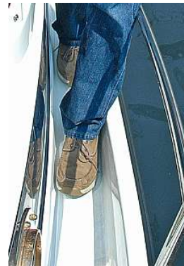
Die strukturierten Gangborde sind bis zu 13 cm breit