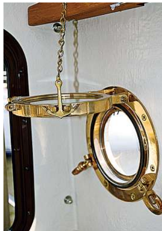
Ein originelles Detail: Messing-Bullauge mit Ankerkettchen