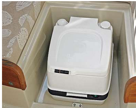
Unter dem Kojenpolster kommt eine Chemie-Toilette zum Vorschein. Gegen Aufpreis ist ein Marine-Pump-WC mit Septiktank erhältlich

Fluid Motion LLC, 25802 Pacific Highway South, Kent, Washington 98032, USA, www.rangertugs.com