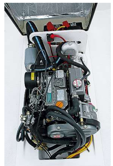
Zuverlässig und sparsam: Der Yanmar-Diesel leistet 22,1 kW