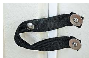
Unschön: Kabinentürarretierung per Druckknopf