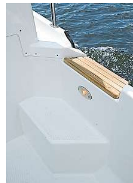
Beleuchtete Stufe zwischen Cockpit und Gangbord

der kompakten Abmessungen überraschend viel Bewegungsraum bietet. In jeder Situation problemlos zu handhaben, lässt sich der mit einem kräftigen Zugfahrzeug trailerbare Verdränger prima für einen Angelausflug in küstennahen Revieren oder für eine gemütliche Spazierfahrt mit der Familie einsetzen. Wenn es um die zu erwartenden laufenden Kosten geht, hat der künftige Ranger-Tugs-Eigner aufgrund des minimalen Spritkonsums einen echten Trumpf im Ärmel. Besonders günstig in der Anschaffung ist der amerikanische 21-Footer allerdings nicht - der aktuelle Basispreis beläuft sich auf 54 933 €.