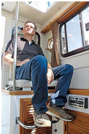
Aus Steckpolstern entsteht eine weitere Sitzmöglichkeit