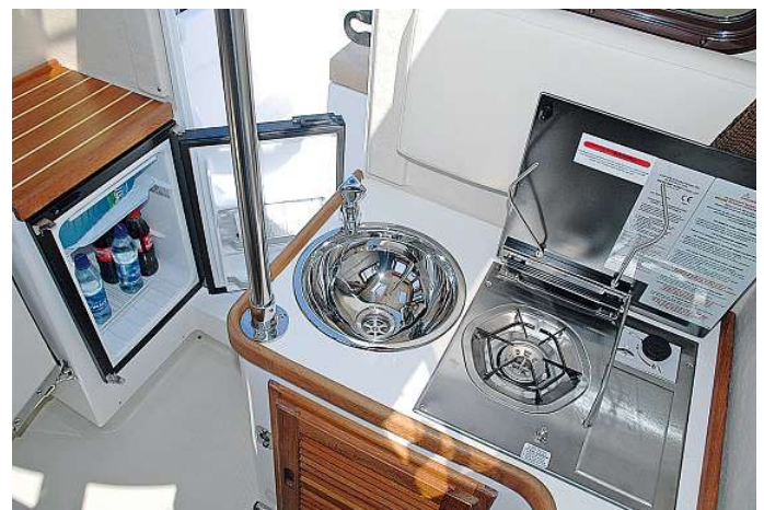
Die Pantryzeile am Eingang des Pilotheuses ist zweigeteilt: Eine Spüle, der 50-l-Kühlschrank und ein Kocher zählen zum Standard