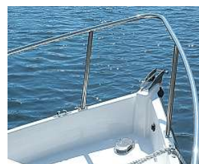
Hochgezogener Bug mit Schanzkleid und Seereling